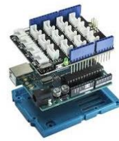
1 carte Arduino shield/Grove