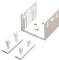
2 supports Grove + fixations