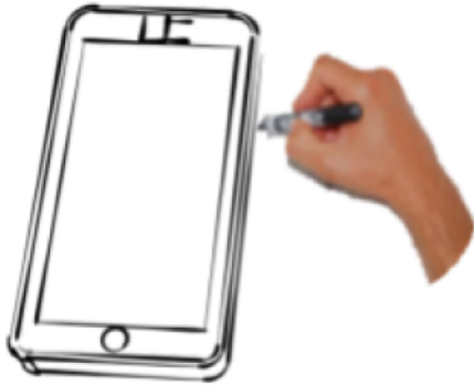
Croquis d'un smartphone en 3D