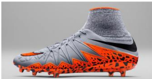
Exemple : La chaussure Nike Hypervenom 2

Utilisation , Chaussure + chaussette, pas de couture, pour le confort. Identité , le logotype Nike et l'association avec le footballeur Neymar, synonymes de qualité et performance. Sens et émotion , dynamisme et agressivité comme valeurs : une sensation de pieds nus.