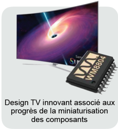
Design TV innovant associé aux progrès de la miniaturisation des composants

La démarche design est une étape de la démarche de projet, les échanges designer/techniciens permettent d'étudier la faisabilité technique du produit et d'apporter des solutions innovantes ou non, envisagées par l'un ou par l'autre.